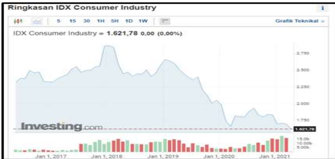
Gambar 1.1 Ringkasan Idx Consumer Industry