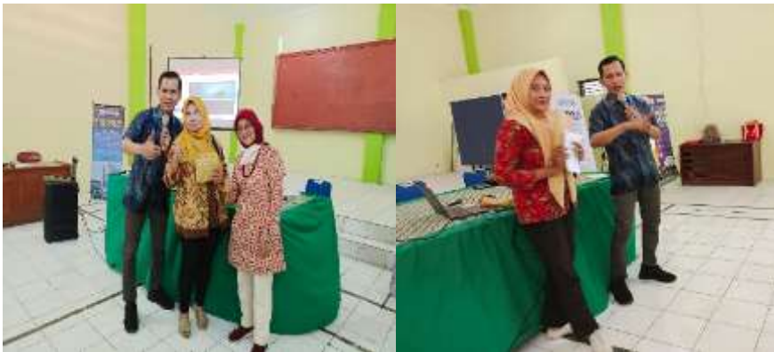
Gambar 3.3. Pemberian Doorprize