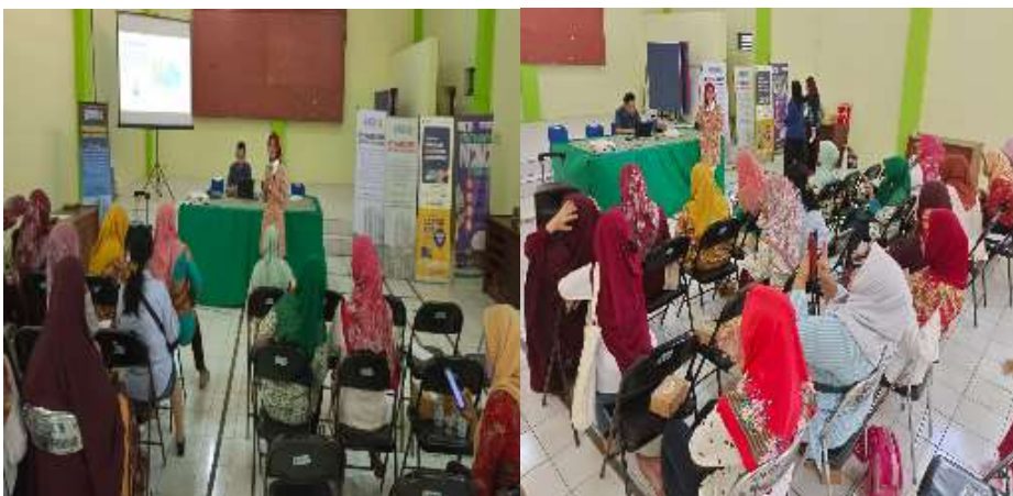
Gambar 3.1. kegiatan ceramah