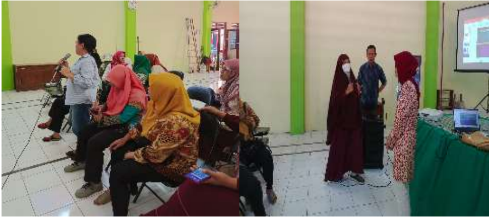
Gambar 3.2. Kegiatan Tanya Jawab