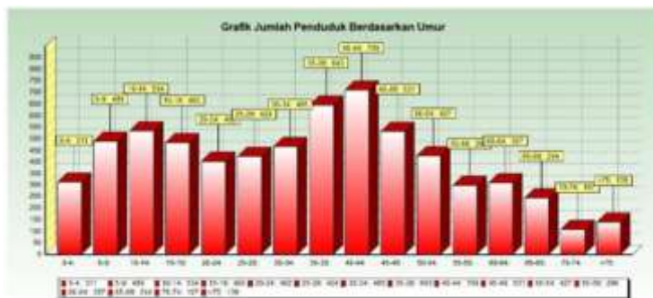
Gambar 1.2. Grafik Jumlah Penduduk berdasarkan Umur

Grafik jumlah penduduk berdasarkan umur seperti pada Gambar 1.2 menunjukkan bahwa jumlah bayi dan balita sebanyak 311, sehingga prioritas pemberdayaan perempuan tahun 2023 adalah pelatihan pembuatan menu sehat bayi dan balita, oleh karenanya program Pengabdian kepada Masyarakat menekankan pada pentingnya informasi yang terkait dengan mengelola menu sehat untuk bayi dan balita..