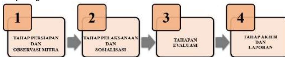
Gambar 2.1. Tahap pelaksanaan

Pelaksanaan kegiatan Pengabdian kepada Masyarakat melalui tahapan yang disajikan pada gambar 2.1