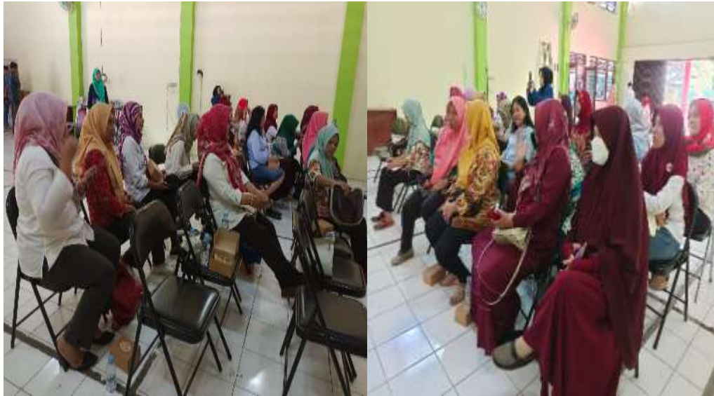
Gambar 3.4. Khalayak Sasaran Kegiatan