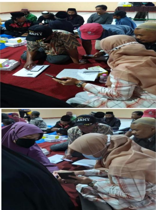
Gambar 4. Kegiatan Pendampingan Digital Marketing

Para petani tanaman hias sangat antusias dalam kegiatan ini. Hal ini terlihat dari banyaknya petani yang hadir yaitu 23 orang. Selain itu, ketika kegiatan pelatihan berlangsung, para petani juga sangat aktif bertanya tentang bagian mana yang belum mereka ketahui. Peserta juga aktif mempraktekkan tutorial yang diberikan hingga akhir.