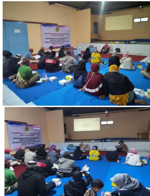
Gambar 3. Kegiatan Pelatihan Digital Marketing

pelatihan dilakukan dengan menggunakan alat bantu LCD proyektor untuk menampilkan tutorial tentang bagaimana membuat email, kemudian email tersebut digunakan untuk login di Google Bisnis untuk menandai lokasi bisnis pada Google Map. Setelah itu, dipaparkan pula tutorial membuat instagram dan bagaimana menggunakan instagram tersebut untuk promosi produk tanaman hias atau jasa pembuatan taman yang para petani sediakan. Selanjutnya, ditampilkan tutorial bagaimana membuat katalog WA Bisnis supaya konsumen dapat melihat produk apa saja yang disediakan melalui gambar-gambar yang ditampilkan, serta keterangan lainnya seperti harga produk yang ditawarkan. Selain dengan memperhatikan tutorial yang disampaikan pembicara, para petani juga dapat menyimak atau mengikuti langkah-langkah tutorial melalui modul yang telah dibagikan. Sehingga, mereka dapat memahami materi yang disajikan dengan maksimal.