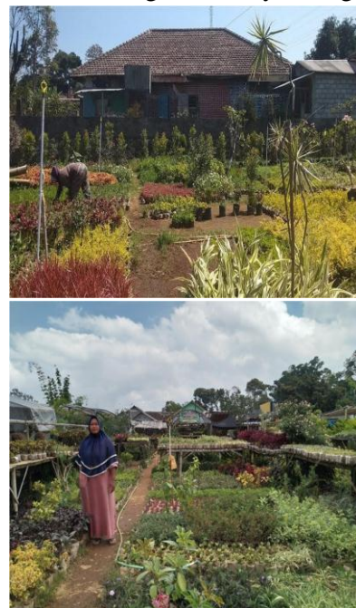
Gambar 1. Kebun Petani Tanaman Hias Sepi Pembeli

Saat ini semakin meningkatnya kasus Covid 19 di Kabupaten Semarang, memaksa pemerintah menerapkan sistem Pemberlakuan Pembatasan Kegiatan Masyarakat (PPKM). Hal ini menyebabkan menurunnya kegiatan ekonomi masyarakat terutama UMKM, tak terkecuali bagi komunitas petani tanaman hias Dusun Tarukan yang mengandalkan banyaknya pengunjung objek wisata di sekitar Dusun. Masalah lain yang dihadapi adalah minimnya pengetahuan petani tanaman hias Dusun Tarukan terkait digital marketing . Oleh karena itu, perlu dilaksanakan sosialisasi, pelatihan dan pendampingan tentang digital marketing kepada komunitas petani tanaman hias Dusun Tarukan. Tujuan dari kegiatan ini adalah untuk membantu mengatasi permasalahan mitra dan salah satu luaran yang ingin dicapai adalah mitra sebagai pelaku UMKM lebih memahami tentang konsep digital marketing serta mampu menerapkannya untuk menjangkau pasar yang lebih luas dan meningkatkannya saing.